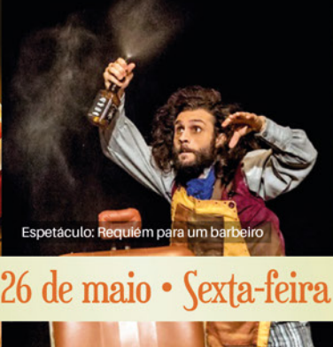
Espetáculo: Requiém para um barbeiro