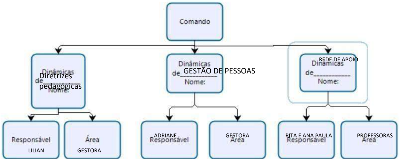
Figura 2: Organograma de um Sistema de Comando Operacional (SCO)

Para a devida aplicação da metodologia proposta, cada uma das caixas no organograma deve ser devidamente nominada (responsável) e identificada com telefone, e-mail, watasapp da pessoa com poder de decisão. Para facilitar a utilização e visibilidade pode-se criar um mural para comunicações, avisos, indicação dos responsáveis e contatos de emergência.