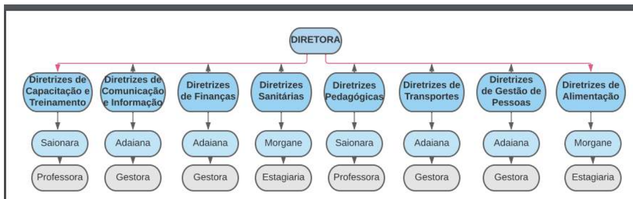
Figura 2: Organograma de um Sistema de Comando Operacional (SCO)

O(a) CENTRO EDUCACIONAL INFANTIL URSINHOS CARINHOSOS LTDA adotou a seguinte estrutura de gestão operacional.